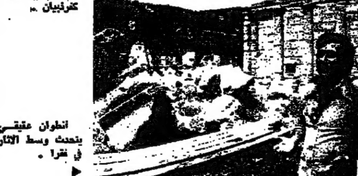
انتوان عتيقي يبحر وسط الاثنا في قفرا